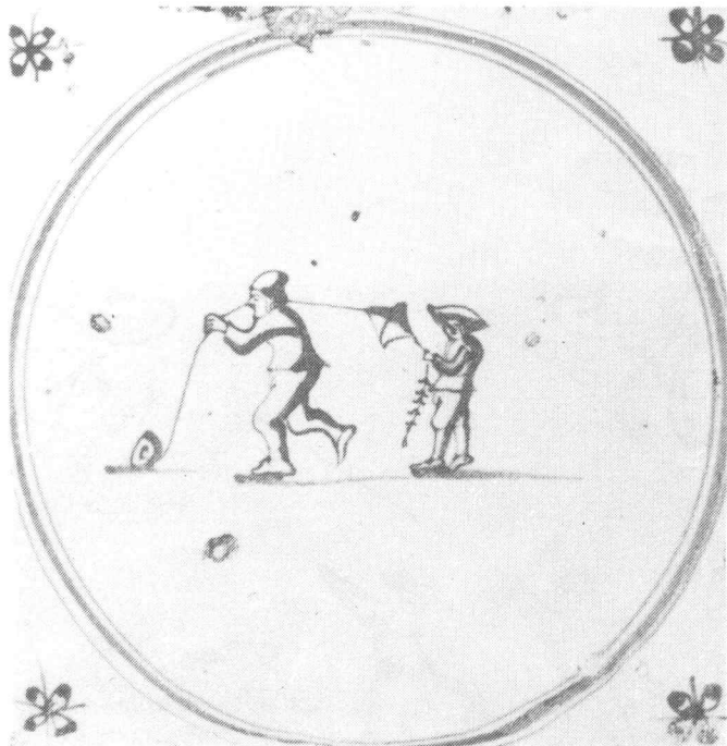
Tegel uit Harlingen, 2e helft 17e eeuw.