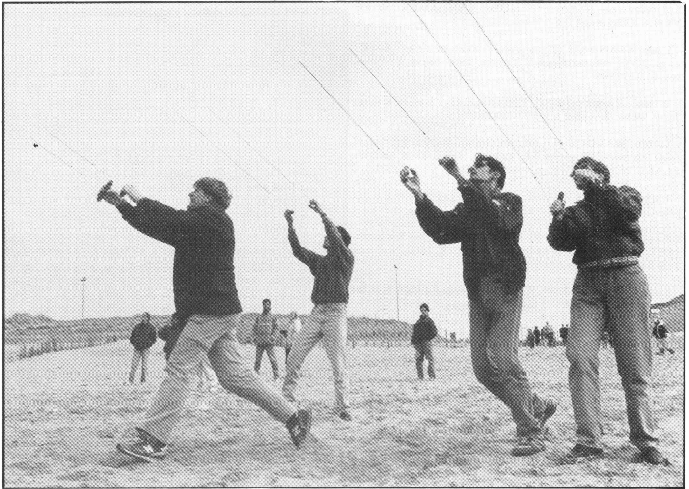
Gespannen lijnen van het vliegerteam "All at once" uit Den Haag.