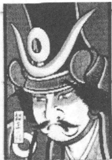
02020109 NANBUNORIMITSU kite NORIMITSU SHIMOMURA