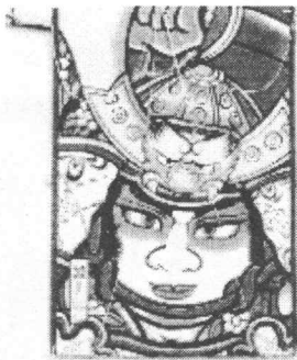
02020107 NANBUNORIMITSU kite NORIMITSU SHIMOMURA