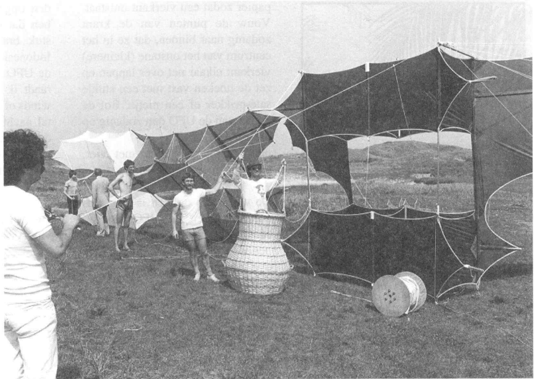
Een deel van het Cody-manlifting systeem op het vliegerfestival te Scheveningen 1983.

In 1913 stierf Cody toen zijn watervliegtuig in de lucht samenklapte. Zijn bijgelovigheid in de kleur groen verbood hem en al zijn passagiers ook maar het geringste stukje van deze kleur te laten dragen. De laatste keer vergat "Papa Cody" zijn passagier te controleren: Luitenant Evans had groene sokken aan!!!