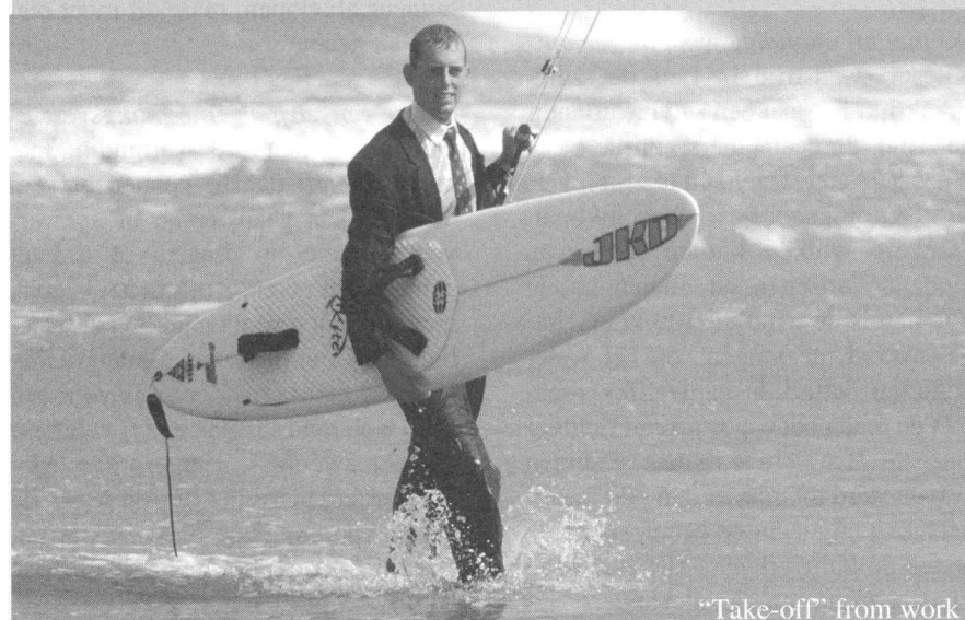
"Take-off" from work