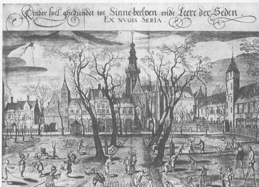
25. First European illustration of a kite of lozenge shape. J. Cats, Silenus Alcibiades , Middelburg, 1618, opposite p. 106.

De oudste Europese vliegerafbeelding is de