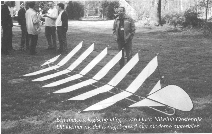
Een meteorologische vlieger van Huco Nikeluit Oostenrijk Dit kleiner model is nagebouwd met moderne materialen